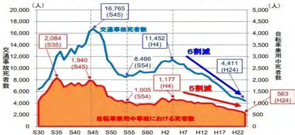
■交通事故死者数に占める自転車乗用中死者数の推移