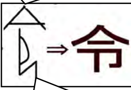
ひざまずく人の図

「頭上に頂く冠の図」と「ひざまずく人の図」から、人がひざまずいて神意を聞く事を意味します。そこから「命ずる・いいつける」を意味する「令」という漢字が成り立ちました。その他に「おさ」、「長官」、「よい」、「立派な」、「優れた」、人の親族に対する敬称を意味します。